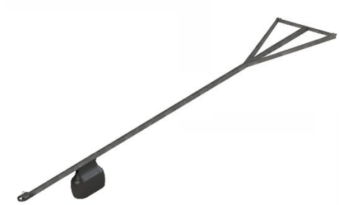
Figur 3 - Når bommen brukes på betongbrygger