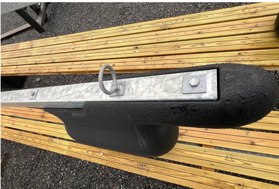
Figur 2 - Montering av pontong til eldre type stålramme (med 3 hull)