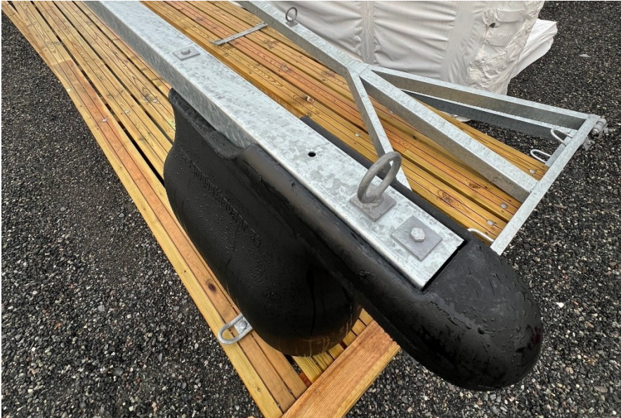
Figur 1 - Montering til av pontong til ny type stålramme (med 4 hull)