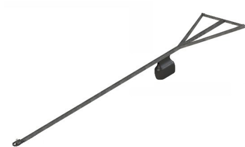
Figur 4 - Når bommen brukes på stål/plastbrygger og badebrygger

2 stk. Bolt 12×160 VZn (varenr. 11-12160)